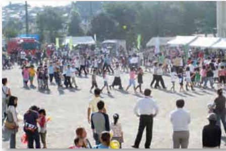
2010年10月：日野第一ふれあいフェスタ（吉原小グラウンド）