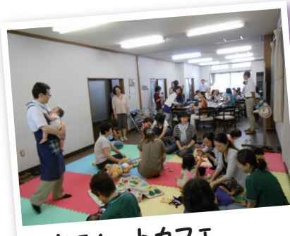
子育てハートカフェ