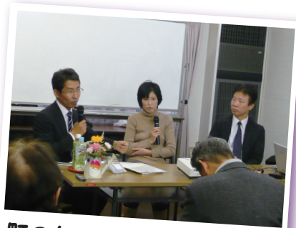
町のちょっといい話講演会