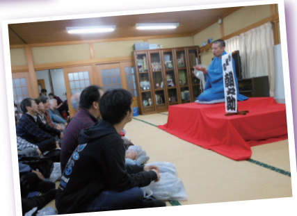
落語deハートカフェ