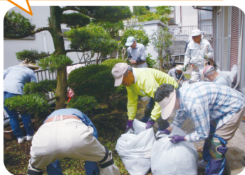
活動の例(草むしり)