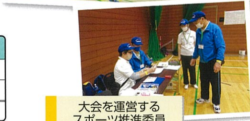
大会を運営する スポーツ推進委員