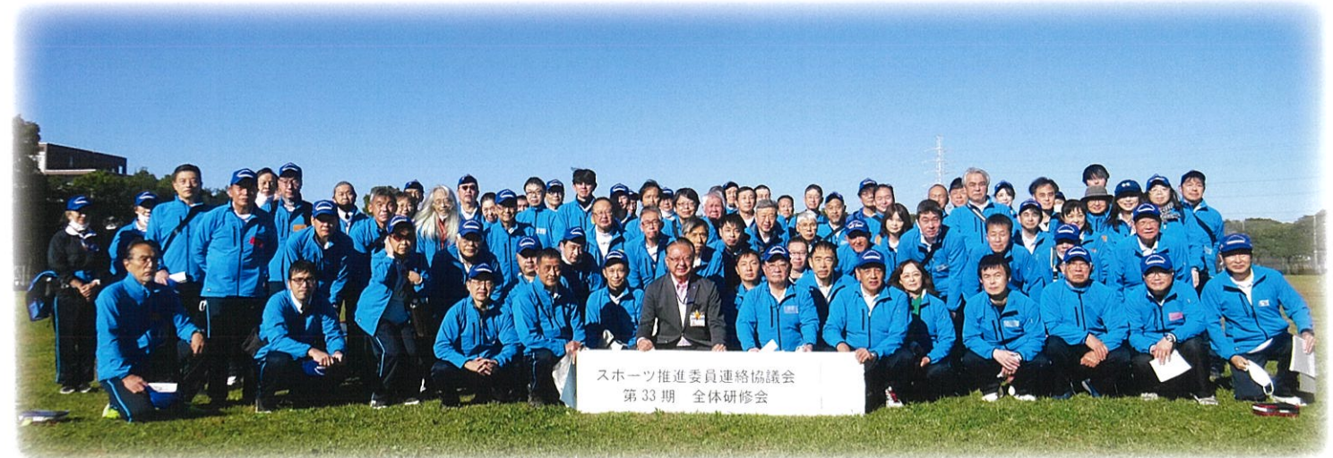
全体研修会(秋)の様子