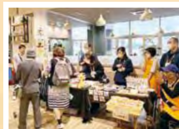
ヨークフーズ上大岡店