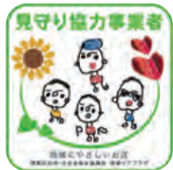
このステッカーが目印です

区内の事業者が、普段のあいさつや声掛けなどをきっかけにして、地域の皆さんの変化や困り事に気づき、見守り協力事業者としてゆるやかに地域を見守ります。 (令和6年9月末現在424事業者)