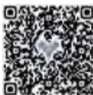
ボランティア申込み

☎ 区役所青少年育成担当 (☎045-847-8396 ☎045-842-8193)