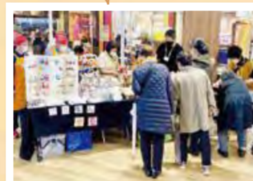
イトヨーカドー上永谷店