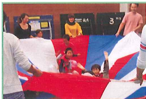
『パラバルーン de あそぼ!』