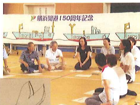
まずはイメージ画づくり！