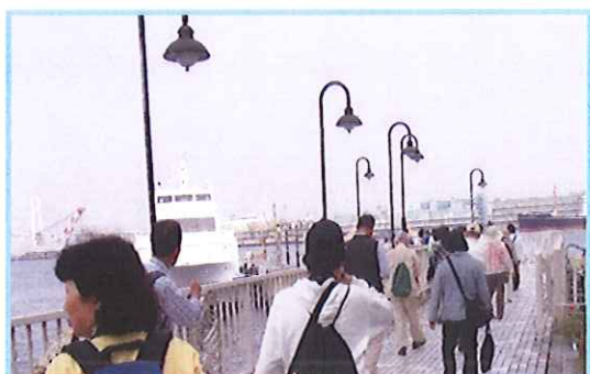
『はまどり艇に乗って横浜港を知ろう』