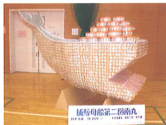
《完成！》したFUNE（船）は港南区役所へ向けていざ出港！