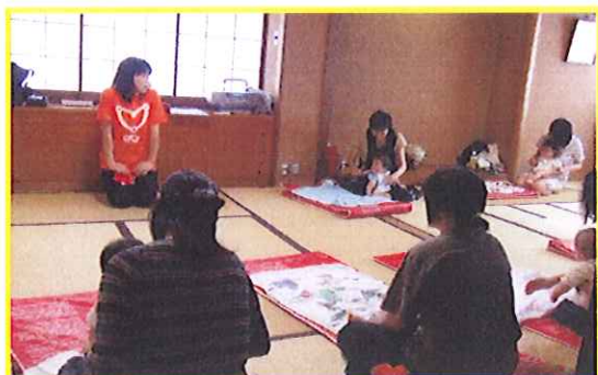
『ママがやさしく赤ちゃんマッサージ』