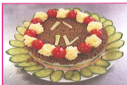
『お節句飾りの押し寿司』