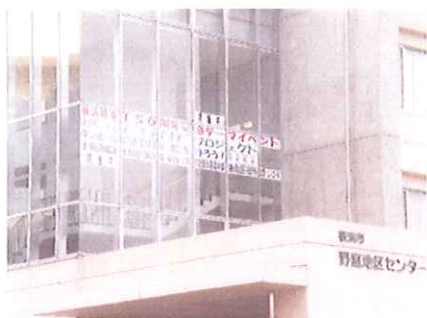
野庭地区センターが会場となり、『ダンボールでFUNE（船）を作ろう！』が開催されました。

港南区区民利用施設協会は、来年の横浜開港 150周年を記念した（財）横浜開港 150周年協会主催のイベント『横浜FUNEプロジェクト』に賛同して、総勢延べ 105 人のみなさんと力を合わせてダンボールを素材とした船（捕鯨母船第二図南丸）を作り上げました。開催期間のうち 1日は野庭すずかけ小学校の児童のみなさんが、先生方と一緒に参加し、真剣かつ楽しげな眼差しでひとつひとつ制作に取り組みました。またお父さん、お母さん、おじいちゃん、おばあちゃんと参加した子供たちもたくさんあり、世代間交流の場となり素敵な時間を共有することができました。