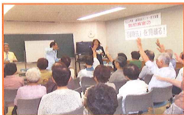
『防犯教室 悪徳商法を見破る!』