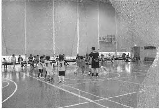
「はじめてのフットサル」