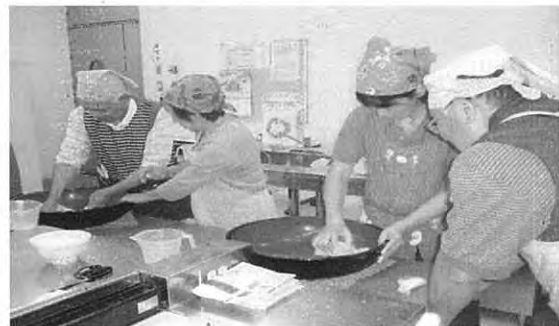
「本格手打ちそば教室」