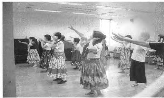
「アロハフラダンス」