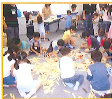
『おもしろ科学で遊ぼう！サイエンス TOY&カプラ』