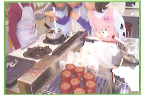
『パレタインチョコレート菓子作り』