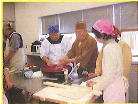
『本格手打ちそば教室』