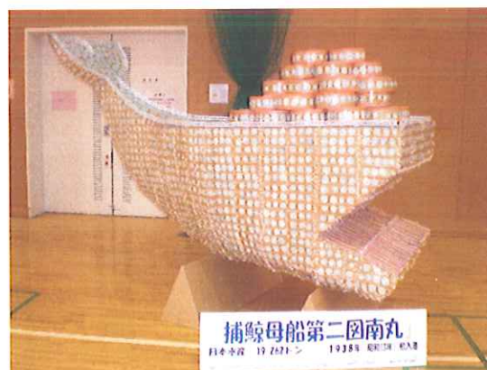
《完成!》したFUNE(船)は港南区役所へ向けていざ出港!