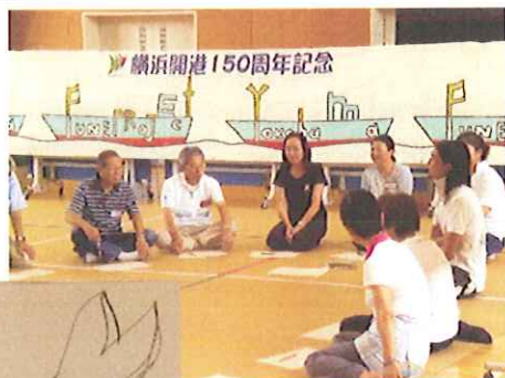
まずはイメージ画づくり!