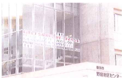
野庭地区センターが会場となり、『ダンボールでFUNE(船)を作ろう!』が開催されました。

港南区区民利用施設協会は、来年の横浜開港150周年を記念した(財)横浜開港150周年協会主催のイベント『横浜FUNEプロジェクト』に賛同して、総勢延べ105人のみなさんと力を合わせてダンボールを素材とした船(捕鯨母船第二図南丸)を作り上げました。開催期間のうち1日は野庭すずかけ小学校の児童のみなさんが、先生方と一緒に参加し、真剣かつ楽しげな眼差しでひとつひとつ制作に取り組みました。またお父さん、お母さん、おじいちゃん、おばあちゃんと参加した子供たちもたくさんあり、世代間交流の場となり素敵な時間を共有することができました。