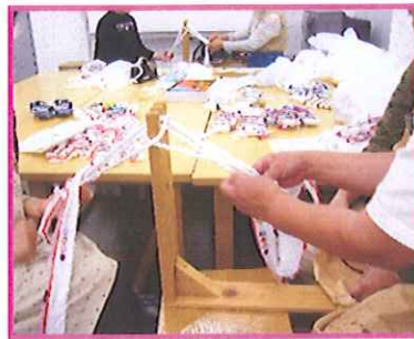
『布ぞうりを作ってみよう』