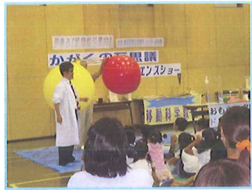
『科学の不思議サイエンスショー』