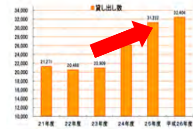
【貸出し冊数の推移】

また図書取次との相乗効果を狙い、利用者増と貸出し冊数を伸ばしていきます。広報活動にも引き続き取り組んでいきます。