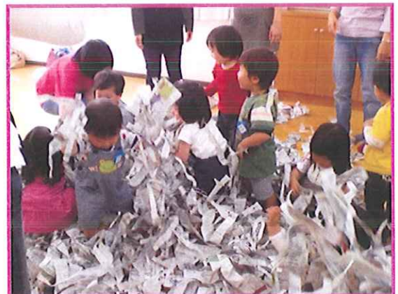
『さくらんぼひろば』