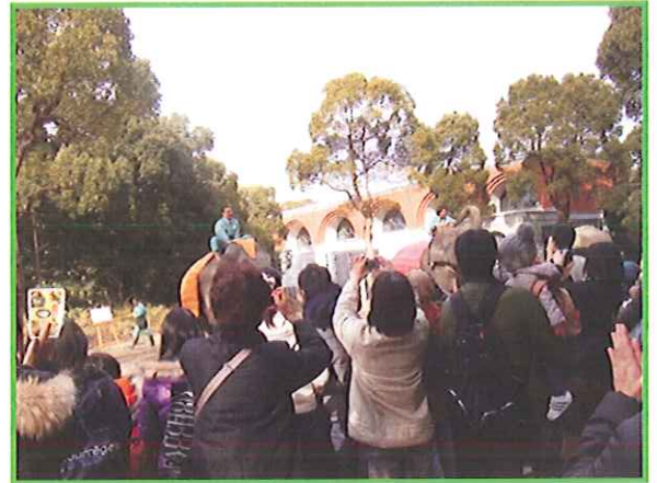
『ズーラシアに行って動物に会おう』