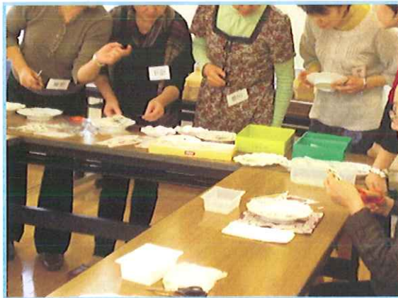
『陶芸教室の様子と作品』