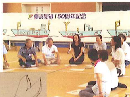
まずはイメージ画づくり!