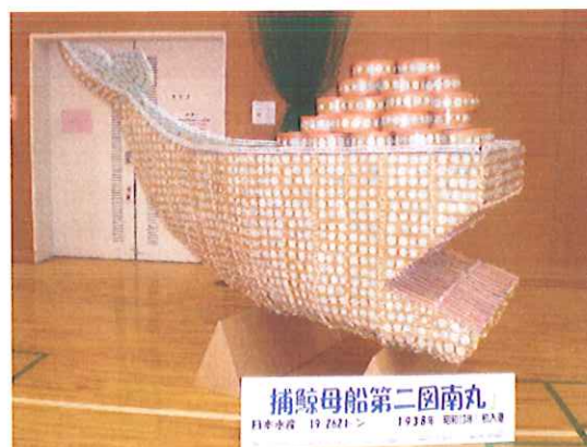
《完成!》したFUNE(船)は港南区役所へ向けていざ出港!