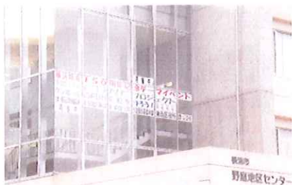
野庭地区センターが会場となり、『ダンボールでFUNE(船)を作ろう!』が開催されました。

港南区区民利用施設協会は、来年の横浜開港150周年を記念した(財)横浜開港150周年協会主催のイベント『横浜FUNEプロジェクト』に賛同して、総勢延べ105人のみなさんと力を合わせてダンボールを素材とした船(捕鯨母船第二図南丸)を作り上げました。開催期間のうち1日は野庭すずかけ小学校の児童のみなさんが、先生方と一緒に参加し、真剣かつ楽しげな眼差しでひとつひとつ制作に取り組みました。またお父さん、お母さん、おじいちゃん、おばあちゃんと参加した子供たちもたくさんあり、世代間交流の場となり素敵な時間を共有することができました。