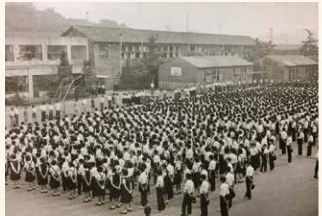
昭和46年に生徒数2,184人、51クラスと最大規模になった港南中学校。 この翌年に笹下中学校が開校します

港南中央駅が開業した時は高校生になっていましたが、通学は相変わらず徒歩でした。だから、駅の思い出は、電車が止まると学校を休める友達がうらやましかったことです。