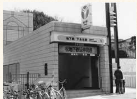
開業当時の駅出口

地下鉄下永谷駅が開業したのは昭和60年(1985年)3月14日。皆さん「駅ができて、生活は一変しました」と言います。「今は上大岡、戸塚に湘南台、どこへ出るのも便利。それに静かで、場所としては一番じゃないかな」。