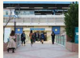
平成19年に完成したペDESTリアン デッキから見た現在の上永谷駅