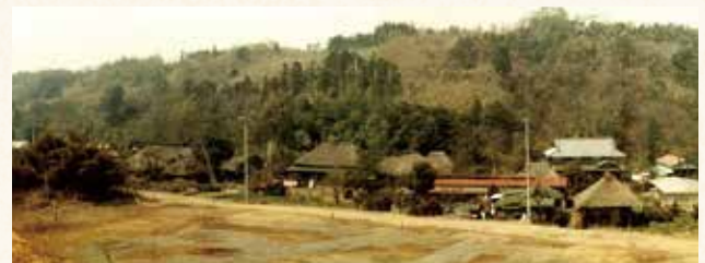
丸山の山頂から望む開発前の丸山地区と貞昌院の裏山・天神山 (昭和46年、現在のイトーヨーカドーの屋上駐車場あたりから撮影:亀野さん提供)