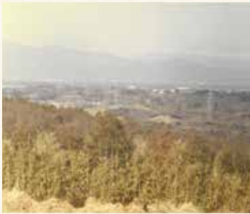
昭和40年前後 (円海山へ続く長野の丘からの眺め)