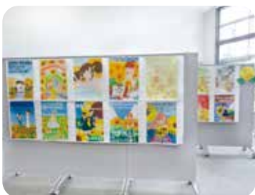
区内中学生によるPRポスター