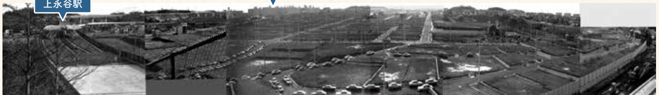
造成工事終了後の丸山台方面(昭和54年11月に貞昌院裏山から撮影:亀野さん提供)