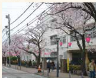
桜の名所として有名な桜道では 昭和49年から「港南桜まつり」が開催されています (左が昭和56年、右が平成19年)