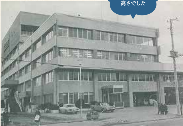
港南区総合庁舎の落成は港南区誕生から2年後の昭和46年。

中学・高校を通して続けていたのは、区役所が主催していた「ジュニアリーダーズクラブ」です。毎年、道志村や群馬県の「赤城林間学園」へキャンプに行っていました。キャンプファイヤーでは、薪の割り方や組み方、火の付け方、ゲームや歌のリードの仕方など、たくさんのことを先輩から教わり、また後輩へと教えていく、という伝統がありました。赤城のキャンプファイヤーの時に見た星空の美しさは今でも心に残っています。