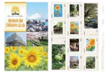
50周年記念オリジナルフレーム切手