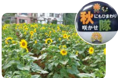
秋のひまわりプロジェクト