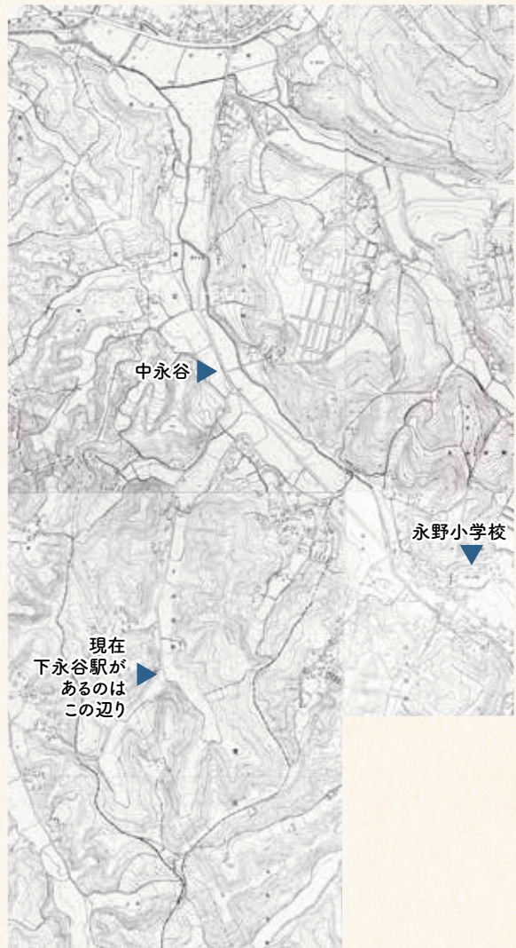
昭和30年代の下永谷周辺。谷間には水田の記号(11)が広がっています【横浜市地形図複製承認番号 令2建都計第9002号】

小学校は、3人とも永野小学校。野庭や芹が谷、山谷交差点(戸塚区)方面からも歩きやバスで児童が通い、雪の日などは10時や11時になってやっと学校にたどり着く子どもたちもいました。昭和40年代に開発が進み、住宅が次々とできました。後に開校した永谷小学校の10周年記念副読本は、永野小学校の児童の増加について「中永谷バス停を利用する児童だけでも160数名となり、一時に集まるので、通勤時間ともかさなって、とてもこんざつしました」と書いています。