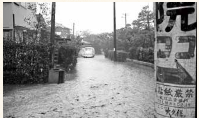
被害が最大となった昭和36年6月28日の洪水。この夜大岡川が氾濫し、周辺は一面水浸しに