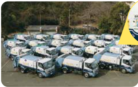
50周年記念サイドパネル付収集車