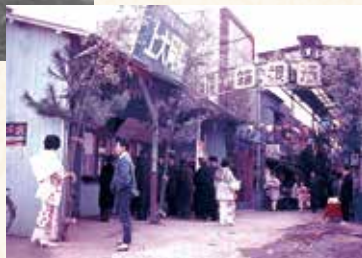
駅ビルへの建替えのために仮駅舎を使っていた昭和37年の正月風景。商店街(現パサージュ上大岡)の名前は大久保にあった花街の通称名「浜の箱根」にちなんで「箱根通」と名付けられました