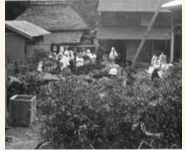
かやぶき屋根の集落があった開発前。冠婚葬祭も「結い仕事」でした