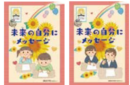
未来の自分にメッセージ