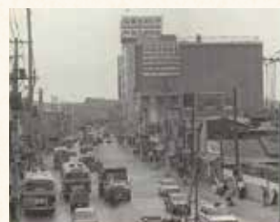
昭和45年の駅前通り