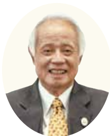
港南区制50周年記念事業 実行委員会委員長