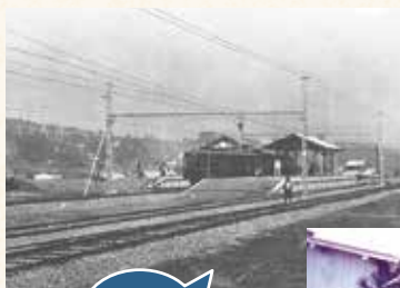
開業(昭和5年4月1日)間もない頃の湘南電鉄(現京急)上大岡駅。

30年代半ばから上大岡は商業地域として発展し、38年には駅ビルが完成。次々と大型店舗ができ、47年12月には、市営地下鉄も開業します。その後、狭い商店街や雑然とした街並みを改良するため、平成4年に再開発事業が開始され、9年に京急百貨店、バスターミナル、オフィスタワーなどの複合施設が完成しました。今や横浜南部地域の拠点にまで成長した上大岡に「信じられないような変貌ぶりだね」と、二人は口をそろえます。