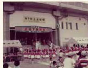
昭和51年9月4日開業時の 記念式典の様子

南側の丸山台は造成中で、ブルドーザーや大型ダンプがまだ走り回っていました。造成により丸山や天神山も削られ平らにならされ、古い集落は新しい住宅街へと変貌していったのです。