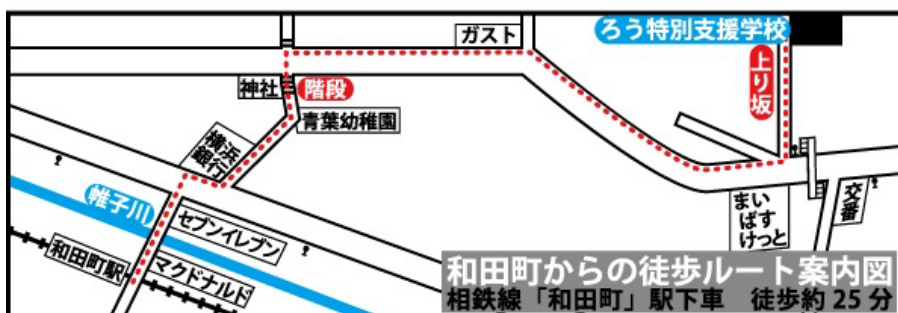
和田町からの徒歩ルート案内図 相鉄線「和田町」駅下車 徒歩約 25 分