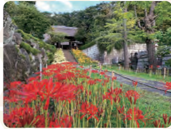
9月下旬には山門へと続く道が3色の彼岸花で彩られます

所在地: 港北区新羽町 2586 アクセス: ブルーライン 新羽駅から徒歩約5分 お問合せ: ☎045-531-2370 受付時間: 9:00~17:00