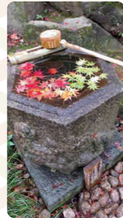
水琴窟。溜まっている水を手前の石に垂らすと、微かに水滴が垂れた音が聞こえます

江戸時代初期に建てられた心行寺。徳川家との縁が深いお寺です。そのため徳川家の家紋・三つ葉葵を本堂に使用するなど、当時はめずらしいお寺でした。心行寺創建以前からこの地に祀られてきた「十一面観世音菩薩立像」は、現在は秘仏として、春分の日と秋分の日2日だけ公開されています。