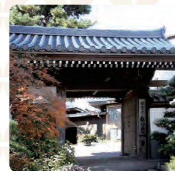
楓園門付近には色づいた草木が、訪れる人々を迎え入れます

市営地下鉄・京急線の駅名でも知られる横浜市最古のお寺・弘明寺。古くは奈良時代までさかのぼり、インドの善無畏三蔵法師が現在も境内にある「七ツ石」を礎石として建てたのがはじまり。国指定重要文化財登録の「本尊十一面観世音菩薩立像」は、御神木に仏を彫ってきた平安時代の仏像です。鉈彫りと呼ばれる珍しい手法によるもの。