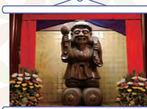
「大黒尊天」 温和な表情の福の神様を求めて多くの参拝客が訪れます

所在地: 鶴見区鶴見 2-1-1 アクセス: ブルーライン新横浜駅から市営バス41系統(鶴見駅西口行)、横浜駅(西口)から市営バス38系統(鶴見駅西口行)「總持寺前」下車 お問合せ: ☎045-581-6021 (総受付) 受付時間: 9:00~17:00