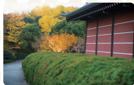
秋には色づいた木々を楽しめます

駅から近い場所ながら、境内はとても静かな雰囲気。秋の涼しい風のなか、11月以降に色づく紅葉が舞い散るひとときは、日常を忘れる程やかさです。約15万坪の広大な境内にあるさまざまな建物とともに、秋の風情を楽しめます。