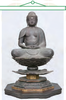
「本尊阿彌陀如来坐像(定朝様式)」 神奈川県指定重要文化財