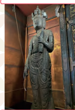
「本尊十一面観世音菩薩立像」 丸ノミのあとが表面にありありと残っています

お寺の中心には本堂を超える高さの銀杏の大木があり、秋になるとあたり一面黄金色に! また境内には桜の木も。春はもちろん、この季節には真っ赤に染まる桜紅葉が楽しめます。銀杏と秋の桜が堪能できる景色は、ここ弘明寺でしか体験できません。