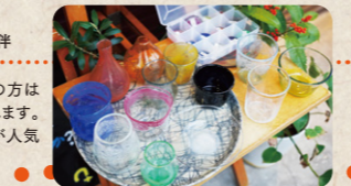
初めての方はサンプルから好きな形、色、泡の有無を選べます。夏は限定色「ラムネ」が人気

グラス、一輪挿し、小鉢などが製作可能。軍手、エプロンは貸し出し用があるので、手ぶらで行けるのが魅力。