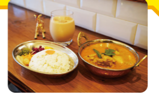
「具だくさん旬野菜と大山(だいせん)のココナッツスパイスカレー」(1,380円・税込)と「自家製チャイ」(土日祝日限定・380円・税込)

管理栄養士とパティシエが始めた、スパイスカレーとクッキーとお菓子のお店です。国産野菜と無添加素材を使ったカレーは、野菜が足りないと感じる人におすすめ。昆布、カツオなどのダシとスパイスを混ぜ、お子さまでも食べやすい味に。この夏ぜひ味わってみては?