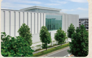
緑に囲まれた施設。充実した設備が魅力

あざみ野子どもぎやらりい2023 ぞうけいラボ 造形あそびができる「研究所(ラボ)」です！コップで絵具を混ぜるアートなジュースづくり、紙を切ってつなげていく紙テープのジャングルづくり、大きな紙にお絵かきなどの研究をしてみませんか？