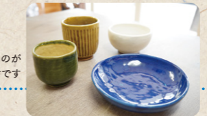
高さがないものが初心者向けです

グニャグニャの土が使えるモノになっていく、ドラマチックな化学変化を楽しんでほしいです。曲がった部分は手づくりの「味」。かたく考えすぎず、まずはやってみてください！