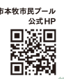
横浜市本牧市民プール 公式HP

開業日：2023年7月上旬 所在地：中区本牧元町 46-1 アクセス：ブルーライン 横浜駅から市営バス8・105系統、根岸駅から市営バス54・91・97系統「本牧市民公園前」下車すぐ *営業時間や利用料金など、詳細は公式HPをご確認ください(6月下旬から掲載予定) *プール入場券と市営バス乗車券のお得なセット券も販売します