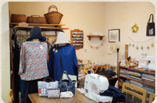
木材のあたたかな空間。隣にカフェスペースもあります