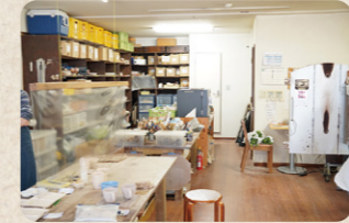
教室内のテーブルには生徒の作品や陶芸の道具がたくさん

特典 ぐるっと夏号をご持参で、体験料金300円割引 期限：2023年8月31日(木)まで