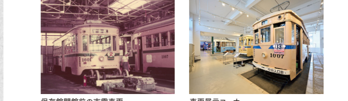
保存館開館前の市電車両 車両展示コーナー

開館50周年を迎えるにあたり、鉄道ジオラマコーナーのリニューアルなど館内コンテンツを充実させ、より一層お客さまに楽しんでいただける施設を目指していきます。 所在地：磯子区滝頭 3-1-53 お問合せ：☎045-754-8505 時間：9:30～17:00(最終入館16:30) 休館日：月曜(祝日の場合は翌日) 料金：大人(高校生以上)300円、3歳から中学生100円