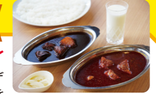
「カシミールカレー(左)」(950円・税込)と「薬膳ボンベイ(右)」(1,050円・税込)。どちらもライス、玉ねぎのピクルス付き。辛さが和らぐ「飲むヨーグルト」(100円・税込)もぜひ*取材時の価格です

根強いファンがいるお店。カレーの名店「デリー」で修業したマスターが、当時のレシピを再現した「カシミールカレー」は、常連客の定番。同じレシピでもつくる人の経験や感性によって味が異なるそうです。辛さが癖になる深い味わいを、ぜひお楽しみください!