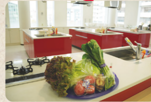
広くて明るい教室。毎回違うテーマのレッスンが開催されています

横浜産の野菜にこだわった料理教室です。7月・8月は親子向けの教室も開催。シェフや生産者から料理を学びます。1階に直売所もあるので、ご家庭でも地産地消を体験してみてください！