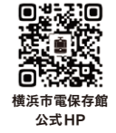
横浜市電保存館 公式HP

横浜市電保存館は、2023年8月25日に開館50周年！約50年前の横浜のまちを実際に走っていた市電車両がズラリと並び、小さなお子さまから大人まで楽しめる博物館。当時の姿のまま車両や停留所を保存し、市電が走っていた時代の「時間」と「空気」を感じられるように再現しています。