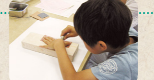
夏休みの自由研究にもおすすめ！ボランティアの方が丁寧に教えてくれます

開催日：公式HPをご確認ください 開催時間：午前の部 10:00～ / 午後の部 13:30～ *所要時間：約1時間半 体験料金：参加費無料、材料費「勾玉キットかつ石」(ピンク450円・税込、白400円・税込) *1階ミュージアムショップで販売 予約方法：公式HPからお申し込みください 誰でも気軽にできる勾玉づくり。やわらかいかつ石という石を削り、昔と同じ製作方法で成形します。