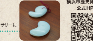
横浜市歴史博物館 公式HP

夏休みの宿題や、大人の趣味に。思い出と作品を手にする体験教室は、夏のお出かけにピッタリ！吹きガラス、手芸、陶芸など、幅広い世代の人が楽しめるワークショップや体験教室を特集します。