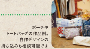
ポーチャートバッグの作品例。自作デザインの持ち込みも相談可能です

初心者にはポーチャートバッグがおすすめ。もっと挑戦したい人にはゴム入りスカートなども。材料は持参か、お店にあるものから選べます。