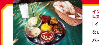
チャイセット(1,390円・税込)。バターチキンカレー、日替わりカレー、ナン、ライス、タンドリーチキン、ガーリックティッカ、サラダ、ソフトドリンク付き

所在地：戸塚区戸塚町120 斎藤ビル2階 営業時間：ランチ 11:00~14:45 ディナー 17:00~20:30(売り切れ次第終了) *火曜はランチタイムのみ営業 定休日：月曜(祝日の場合は翌日、不定休) *臨時休業や時間変更は、お電話または公式Twitter (@Yokohama_Bombay) でご確認ください アクセス：ブルーライン 戸塚駅7番出口から徒歩約7分 お問合せ：☎045-864-1133