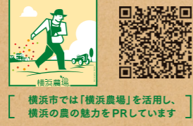
横浜市では「横浜農場」を活用し、横浜の農の魅力PRをしています

横浜市交通局広報誌ぐるっと 夏号 発行日: 令和5年6月15日 発行: 横浜市交通局 総務課 企画・制作: ぐるっと編集部(株式会社ボイス)