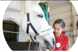
手からじんじんを食べるエレスト号。大きな体は迫力満点

所在地: 中区日本大通11 横浜情報文化センター内8階 開館時間: 10:00~17:00 休館日: 月曜(祝日・振替休日の場合は翌日)、年末年始 入館料: 無料 アクセス: ブルーライン 案内駅出口1から徒歩約10分または桜木町駅から市営バス8・20・21・58・158系統またはあかいづつ「日本大通り駅前行」下車徒歩約1分 お問合せ: ☎045-222-2828