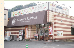
横浜のオアシスと呼ばれるのどかな舞岡。お散歩がてら立ち寄る人も