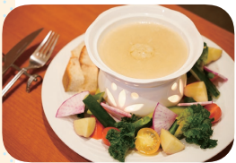
「チェルボのパニーナカドゥー」(1,500円+税込)は、野菜それぞれの味、色、香り、食感をじっくり味わえる一品

泉区中田産の野菜にこだわった家庭的なイタリアンレストラン。店主自身が季節の変化を楽しみ、その時々野菜を中心にメニューを構成します。お客さまの好みに合わせて味付けを変えらるなど、ささやかな心遣いも欠かしません。