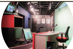
お天アリポーターやニュース番組アナウンサーになれる「ニューススタジオ」