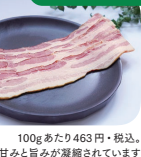
100gあたり463円+税込。脂の旨みと旨みが凝縮されています