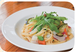
「オルトラーナ」(1,580円+税込)、季節の都筑野菜を10種類ほど使用