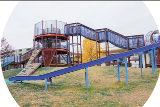
遊具後方の高速道路を走る自動車に釘付けになる子ども

巨大な遊具で人気の公園。長いローラー滑り台や、ロープを編んだ通路で思う存分体を動かして遊べる。ベンチや軽い運動ができる器具、幼児向け遊具もあるため、世代を問わずお散歩を楽しめます。