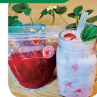
460円+税込。果肉がゴロリと入っています

同店が経営する、店舗隣の舞岡いちご園のいちごを贅沢に使った人気商品。本商品と牛乳を1:1で混ぜていちごミルクにするほか、ヨーグルトソースにしても良し。いろいろな食べ方で楽しめます。