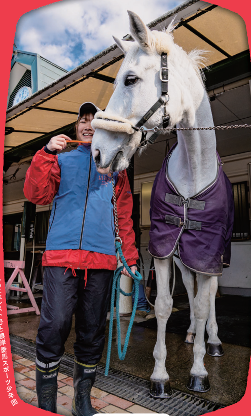
根岸競馬記念公苑(ポニーセンター)のエレスト号と根岸競馬スポット「少年団」