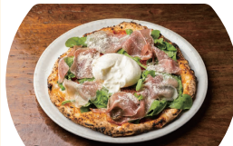
「ブロッコチーズのピッツァ」(3,430円+税込)。チーズがとろりと溶け出す人気メニュー

特典 ぐるっと春号をご持参のうえ、お食事のお召し上がりメニュー(ナポリ名物のおつまみ)をサービス 期間: 2024年4月30日(火)まで