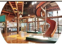
子どもたちの安全・安心のため、丁寧な清掃と手入れが行われています

踊場駅の踊る猫伝説にちなんで「ニヤぱく岩」の愛称で親しまれるログハウス。2階からの滑り台や、ハンモックが人気です。大きな窓から日差しと木のぬくもりの中で、冒険するように遊べます。