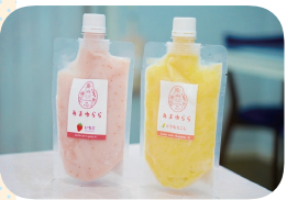
人も犬も食べられる生甘酒の「あまやら」(1個 1,200円+税込)、港北区のながさわファームのいちご(左)と戸塚区のフジファームのとうもろこし(右)を使用