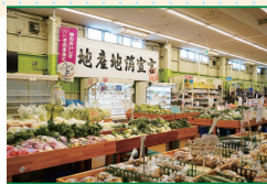
直売所では市内一品ぞろえ、珍しい野菜も多く、レストランのシェフが仕入れに来ることも

大根の酢漬けと高菜の塩漬け。小松菜やあさり、白菜など、日によって種類が異なります