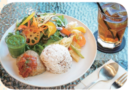
選べるメインディッシュに、副菜3品と地産産物野菜サラダ、ドリンクがつく「ワンプレート＆ドリンク」(1,300円+税込)