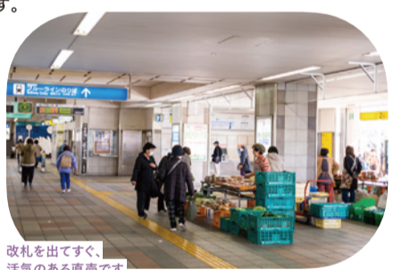
改札を出てすぐ、活気のある直売です

営業時間：10:00～17:00(小間園芸) 12:00～17:00(自然館泉) *時間が前後することがございます 開催日：火・木曜(小間園芸) *8月と9月は火曜のみ 火・金曜(自然館泉) アクセス：ブルーライン 立場駅改札前 お問合せ：☎045-802-0124(小間園芸) ☎045-802-3297(自然館泉)