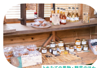
とれたての果物・野菜のほか、加工品の直売も人気

営業時間：11:00～17:00 定休日：月～木曜 アクセス：ブルーライン 上永谷駅から市営バス45系統「京急ニュータウン」下車徒歩約5分 またはブルーライン 舞岡駅出口1から徒歩約20分 お問合せ：☎045-823-1222