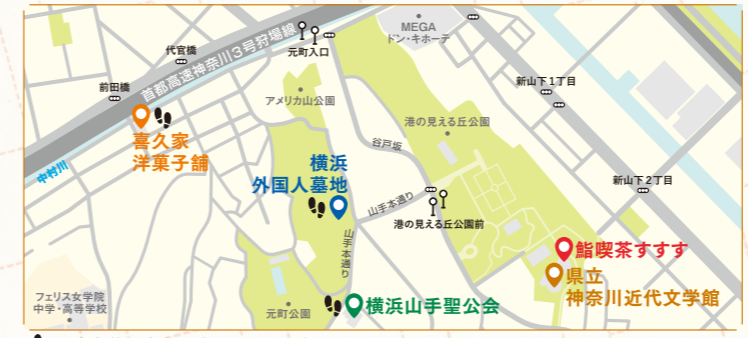
中島敦が実際に訪れていたスポット

特典 「ぐるっとを見た」と言ってくださったお客さままで志賀直哉の作品をイメージした「小僧の神様の握り鮭」(9貫4,800円・税込)をご注文の方に、お好きな寿司1貫サービス 期限: 2025年4月24日(木)まで