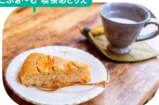
「ふあ〜む果実の手づくりケーキ」(300円・税込)と「梅ホット」(400円・税込)

果樹・野菜農園「かねこふあ〜む」直営の喫茶店でいただける、旬の果実の手づくりケーキ。素材の味がやさしく体に染みます。店内はアットホームな雰囲気、テラス席もおすすめ。