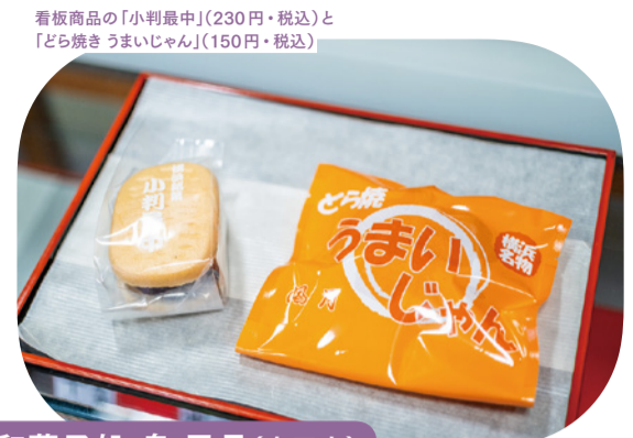
看板商品の「小判最中」(230円・税込)と「どら焼きうまいじゃん」(150円・税込)