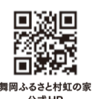
舞岡ふるさと村虹の家公式HP