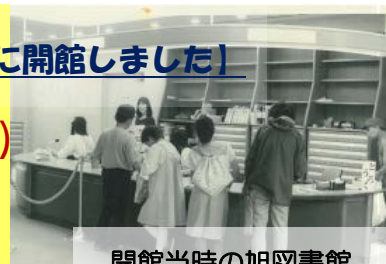
開館当時の旭図書館