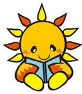
旭区マスコットキャラクター あさひくん