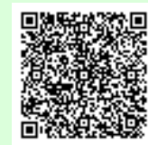
スマートフォン用