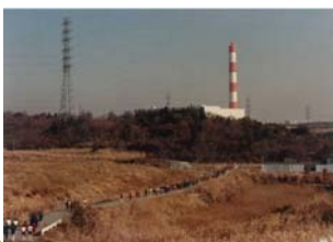
都筑区:ふれあいの丘付近 (1980年撮影)