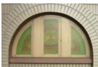
神奈川図書館の ステンドグラス