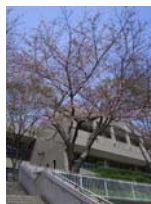
神奈川図書館 (平成23年4月撮影)

神奈川図書館では来年開館25周年を迎えるのに合わせ、郷土に関する催しもの等も計画しています。どうぞご期待ください。