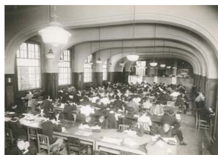
横浜市図書館 (現中央図書館の前身)閲覧室 年代不明