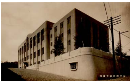
横浜市図書館 (現中央図書館の前身)竣工 昭和2年

その後、2度の移転をし、ようやく昭和2年7月、野毛の地に横浜市図書館（現中央図書館の前身）が竣工したのです。