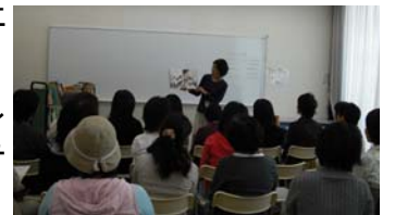
読み聞かせボランティア講座 (金沢図書館)

市立図書館では、ボランティアをこれから始める方のための講座や、すでに活動中のボランティアのための講座などを実施しています。また、ボランティアの交流会を実施している図書館もあります。