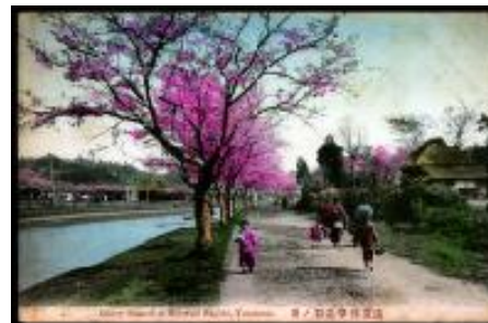
横浜根岸堀割ノ桜