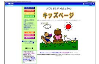
横浜市立図書館キッズページ http://www.city.yokohama.jp/me/kyoiku/library/kids/

図書館ホームページの中のキッズページでは、毎月のおすすめの本や、年齢別のおすすめの本の情報を掲載しています。また、おすすめの本のリストを配布することもあります。