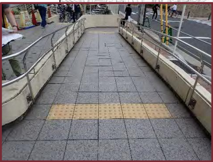
【戸塚地区センター・戸塚図書館・戸塚公会堂】 ◆滑りにくいスロープへの改善