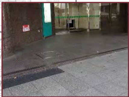
【戸塚駅東口駅前広場】 ●駅前広場とビル入口の段差の解消