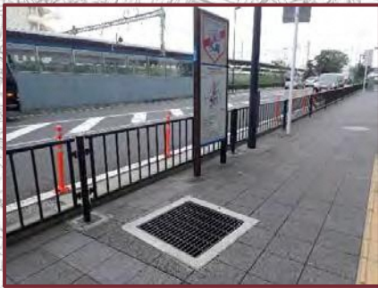
【戸塚区役所周辺の道路】 ●車いすや白杖がはまらないように グレーチングの改修