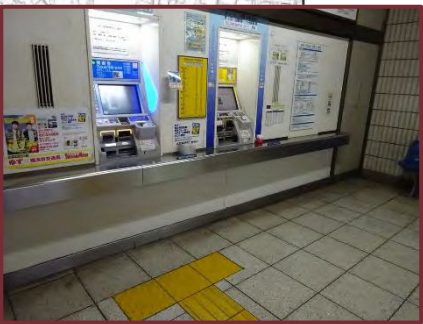
【地下鉄戸塚駅】 ◆車いすの方の膝がぶつからないようにするなど、 障害者等の利用に適した券売機の設置