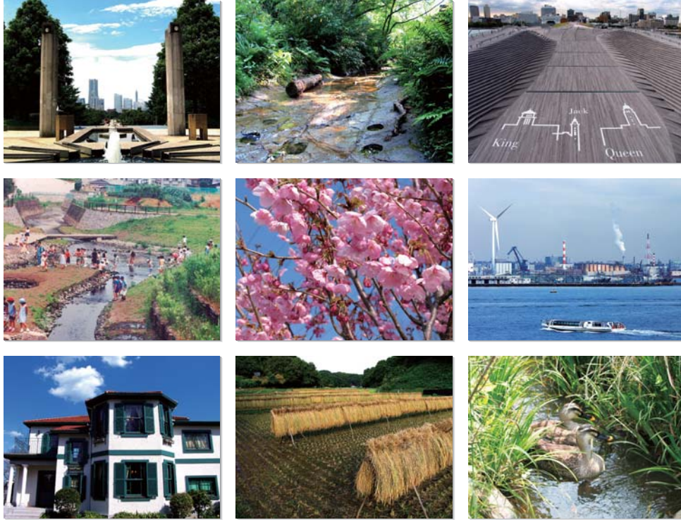
上段左/山下公園(市民活力推進局広報課提供) 上段中/氷取沢市民の森(市民活力推進局広報課提供) 上段右/大棧橋(市民活力推進局広報課提供) 中段左/梅田川(環境創造局) 中段中/ヨコハマヒザクラ(市民活力推進局広報課提供) 中段右/ハマウイング(市民活力推進局広報課提供) 下段左/プラザ18番館1(市民活力推進局広報課提供) 下段中/寺家ふるさと村(市民活力推進局広報課提供) 下段右/舞岡町小川アメニティ(環境創造局)