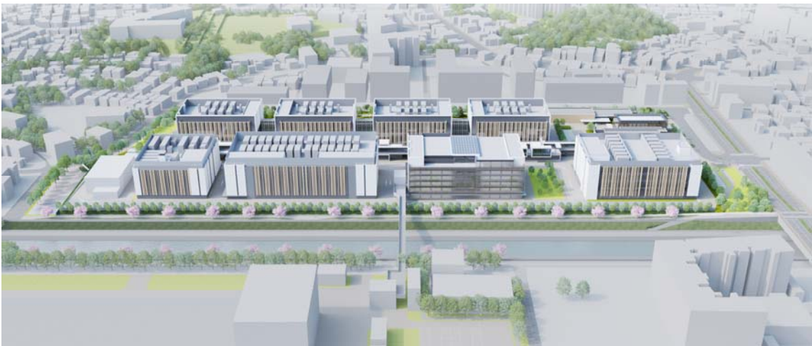
図3 完成イメージ図（西側からのイメージ）