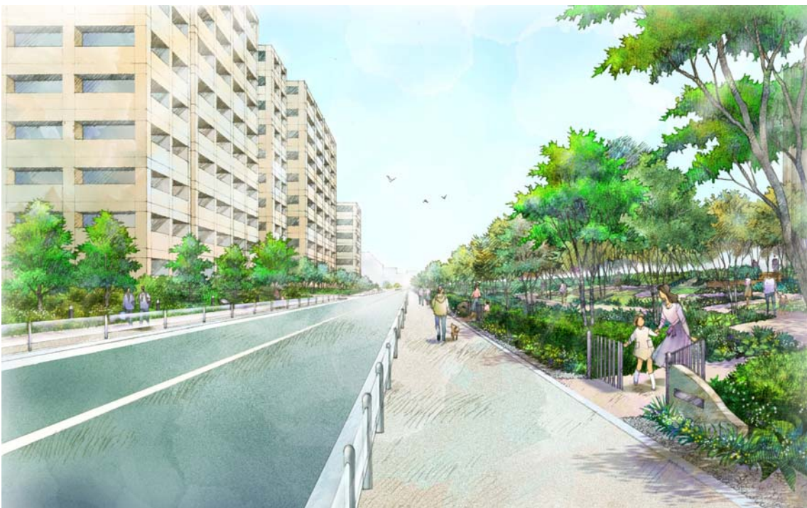
図5 緑道内イメージ図（北側から南方向を望む）