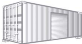
コンテナ（倉庫・店舗の用途）