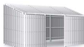
単管パイプ組による屋根掛け