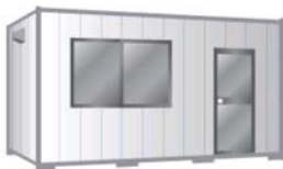
プレハブ・ユニットハウス