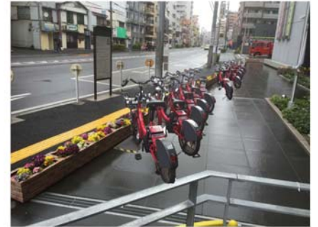
No. 60 南区総合庁舎

（平成 29 年 6 月 28 日 OPEN 予定） 「阪東橋駅」と「南区総合庁舎」の間にある高根町歩道橋の下に設置します。横浜橋通商店街にも近いポートです。