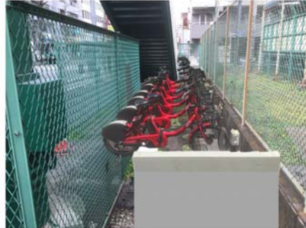
No. 59 南吉田小学校交差点

（平成 29 年 6 月 20 日 OPEN 予定） 市営地下鉄「阪東橋駅」の地上出入口近くに設置します。鉄道からの乗換えもスムーズに行えます。