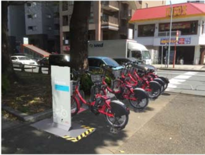
No. 58 阪東橋駅

（平成 29 年 6 月 20 日 OPEN 予定） 市営地下鉄「阪東橋駅」の地上出入口近くに設置します。鉄道からの乗換えもスムーズに行えます。