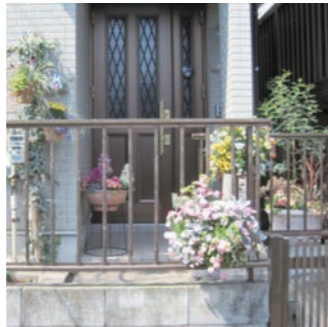
▲ハンギングバスケットの設置