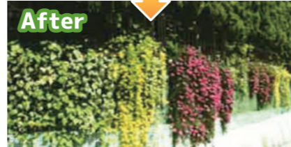
▲民有地の壁面緑化