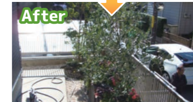
▲プランターによる民有地緑化