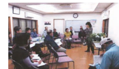
▲草花の育成に関する講習会の様子