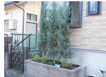
▲民有地の沿道緑化