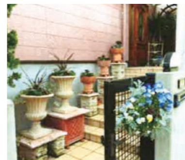
▲玄関先にプランターの設置