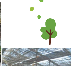
▲民有地の壁面緑化