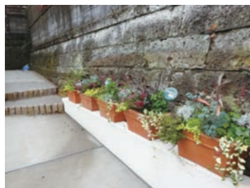
▲駐車場にプランターの設置