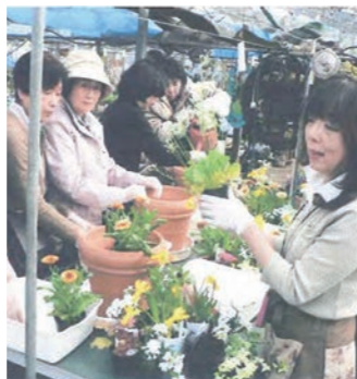
▲コンテナガーデン研修会の様子