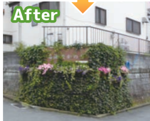
▲地区の玄関口を緑化