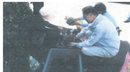
▲地区の玄関口プランターの植替えの様子