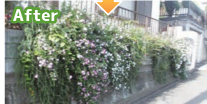
▲民有地の壁面緑化