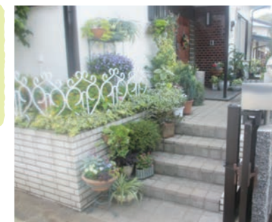
▲民有地の沿道緑化