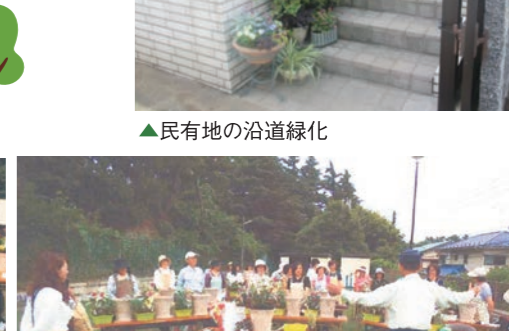
▲プランター寄せ植え講習会の様子