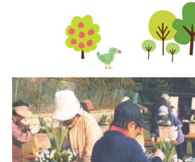
▲鉢寄せ植え講習会の様子