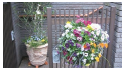
▲玄関前にハンギングバスケットの設置