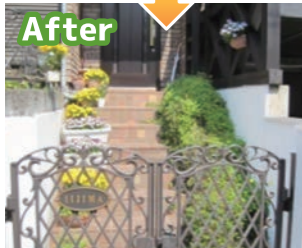
▲玄関前にプランターの設置