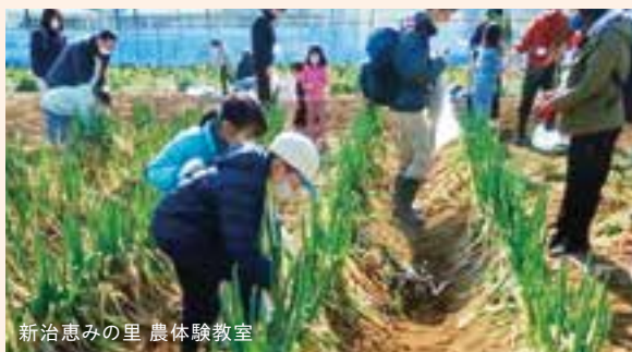
新治恵みの里 農体験教室