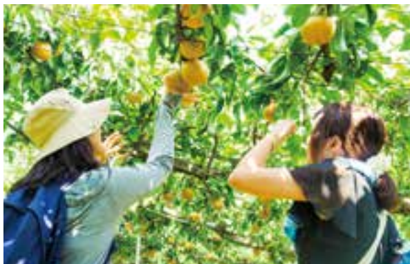
収穫体験農園 果物のもぎとり体験