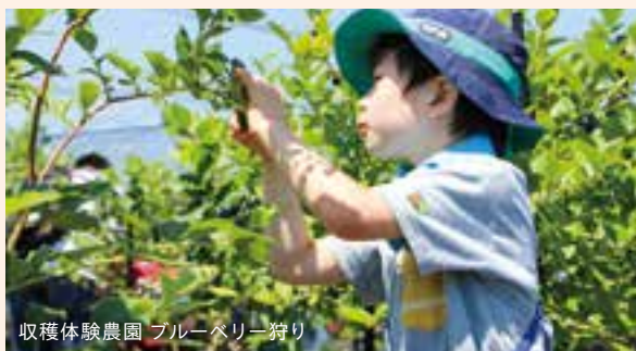
収穫体験農園 ブルーベリー狩り