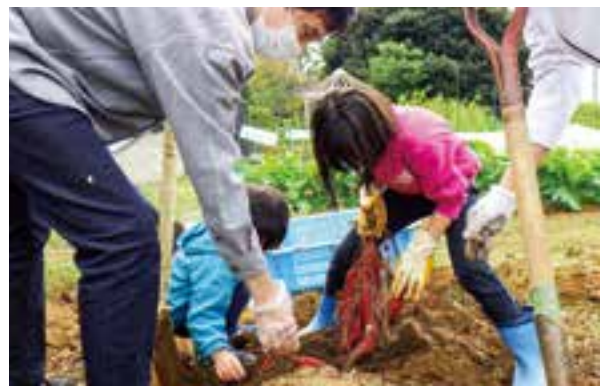
家族で学ぶ農体験講座

市民農業大学講座や家族で学ぶ農体験講座を開催し、市民が栽培技術などを学ぶ場を提供します。子どもたちが楽しく農を学べるよう、家族で参加できる農体験講座の充実に取り組みます。また、援農コーディネーター(※)等を活用し、市民農業大学講座修了生などによる農家への援農活動を支援します。