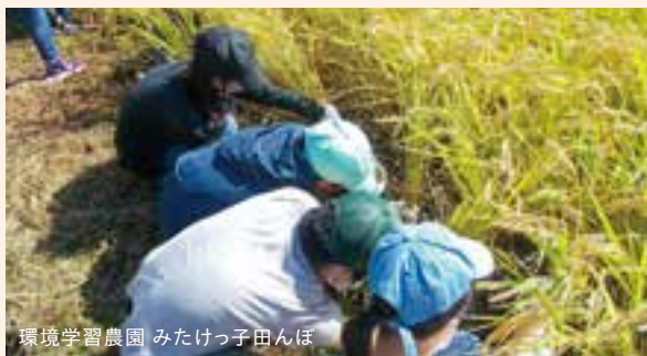
環境学習農園 みたけっ子田んぼ