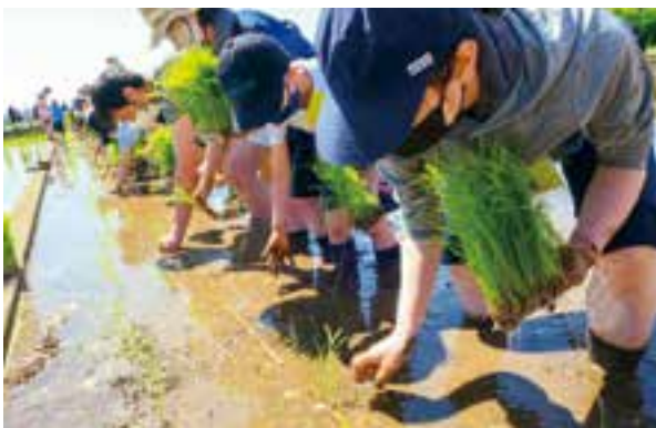
田奈恵みの里の体験水田

さらに、市内全域で農体験に関する様々な相談に応じるため、専門知識やスキルを有するコーディネーターを派遣します。