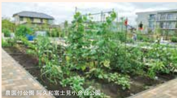
農園付公園 阿久和富士見小金台公園