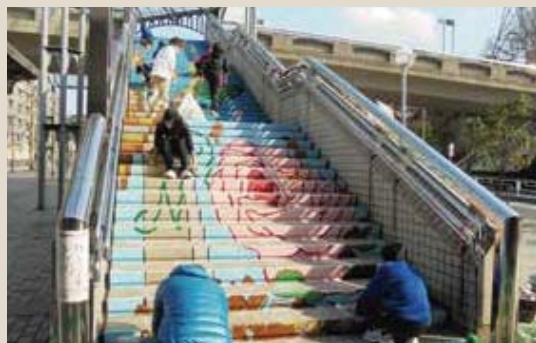
▲地元中学校による駅前階段アート