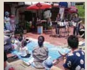
▲トロピカルコンサートinバザー&フリマ