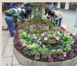
▲冬の「シンボル花壇」づくり