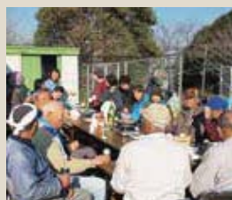
▲畑作業後の住民同士の交流