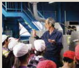
▲地元企業にものづくりを学ぶ