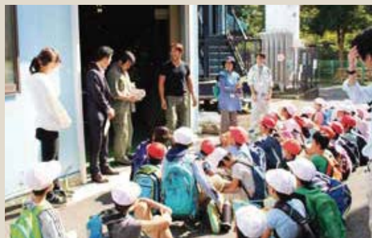
▲「こどもまち探検」で企業を訪問