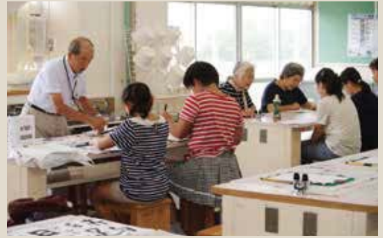
▲地域の人が教える書道、詩吟教室