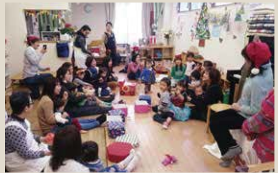
▲ひろば利用者によるクリスマス会