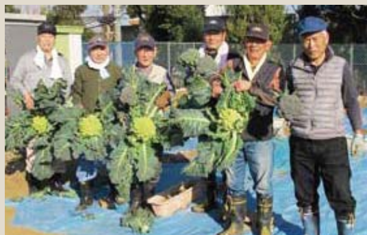
▲畑で栽培した野菜の収穫

高齢者が家に閉じこもらず青空の下、農作業を通じてお互いに見守る場として開設された六ツ川野外サロン。その活動から始まった多様な展開は実に見応えがある。家庭や学校などから排出される生ゴミの堆肥化（環境保全）、農園で収穫した野菜を販売する「朝市サロン」（買い物支援・居場所・収益）、親子で参加する収穫祭（多世代交流）など、「農」の多面的な意義を改めて教えてくれる。それまで自治会活動に関心のなかった人が、サロンの活動に参加したことがきっかけで地域活動に関心を深め自治会役員に手を挙げるに至るエピソードは、野外サロンと地域の魅力的なつながりを物語っている。（奥村委員）