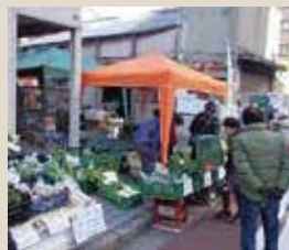
▲保土ケ谷名産品の朝市「ごうどいち」