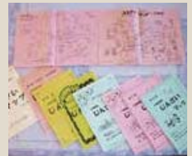
▲人材マップ改編の歴史