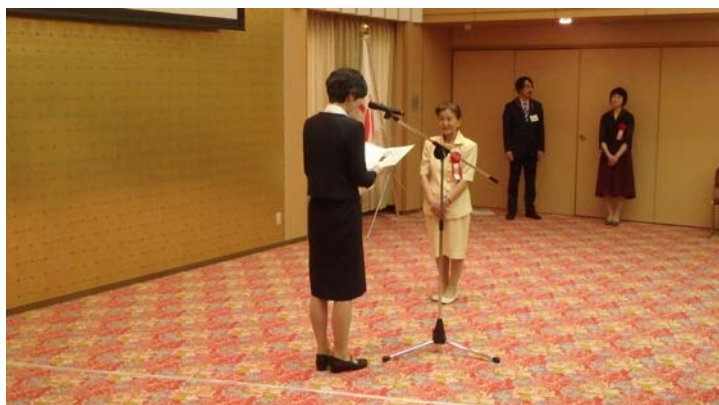
▲薬師寺都市整備局長からの表彰状授与