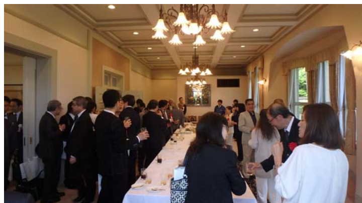
▲ティーパーティー