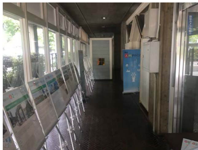
▲市庁舎1階市民広間