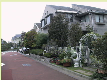
○中区新本牧地区 塀は生垣またはネット等の透視性のあるものとしています。