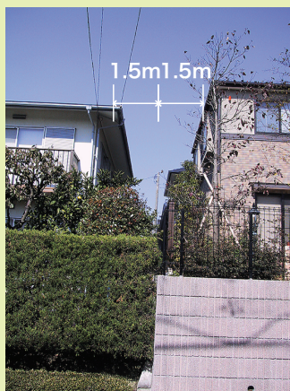
○栄区庄戸第一地区 隣地境界線から1.5m以上、下がって建てています。