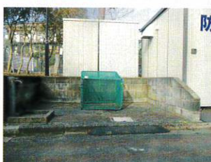
宮根団地自治会様