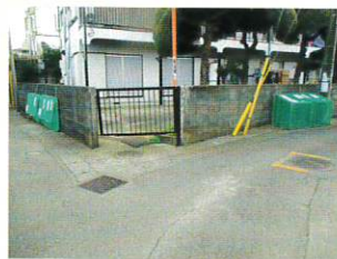
台村・森の台自治会様