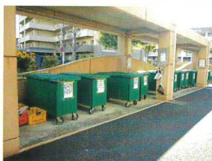
十日市場ヒルタウン 第五自治会様