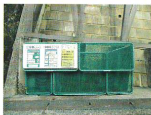
中山自治会 集積場10-2利用者様