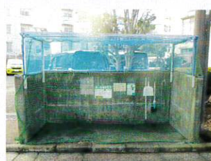
三保グリーンハイツ 自治会様