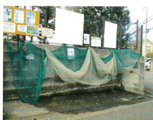
下長津田自治会様