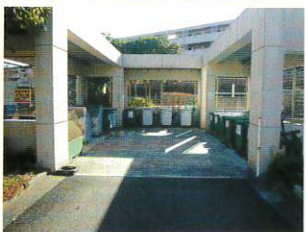
十日市場ヒルタウン 第八自治会様