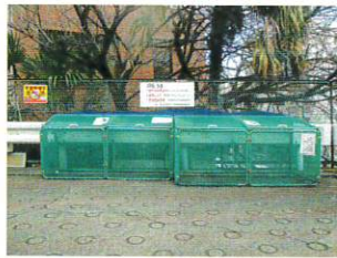
台村・森の台自治会様