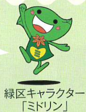
緑区キャラクター「ミドリん」