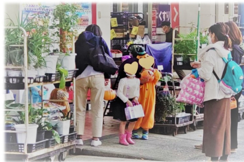
ハロウィンイベント(R4.10.28~29)