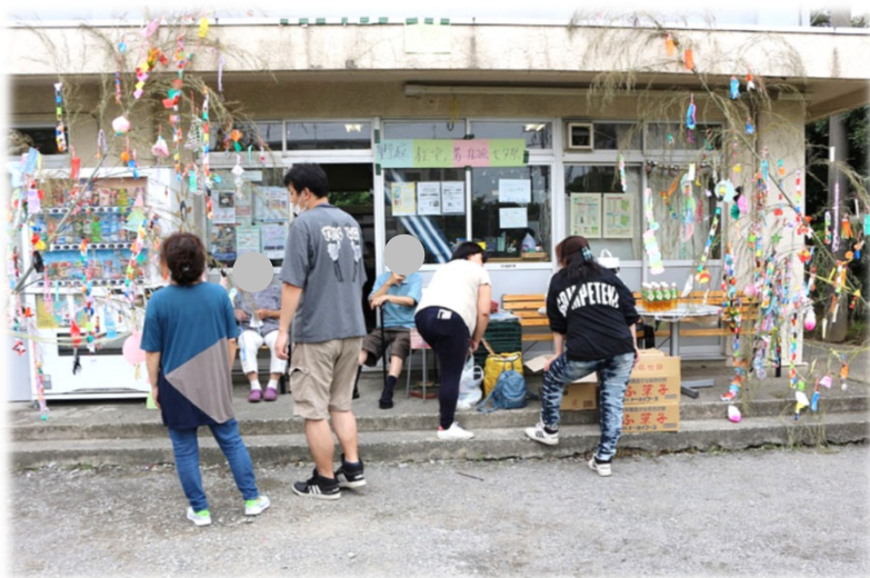
市営第一集会所 七夕