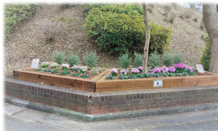
オアシス 交差点花壇