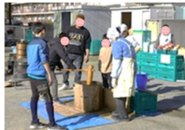
餅つきの様子(港南区HPより)