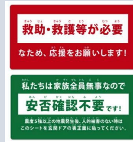
▲ 安否確認マグネット