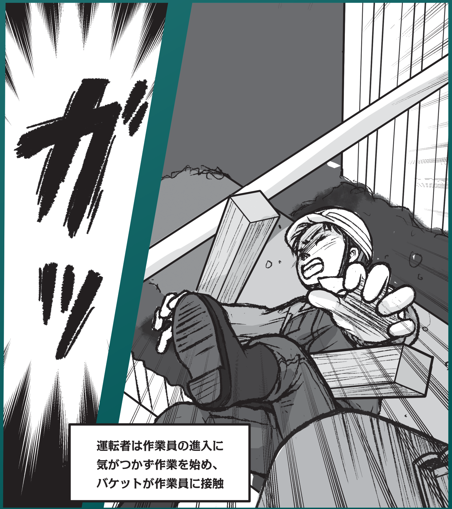
運転者は作業員の進入に気がつかず作業を始め、バケットが作業員に接触