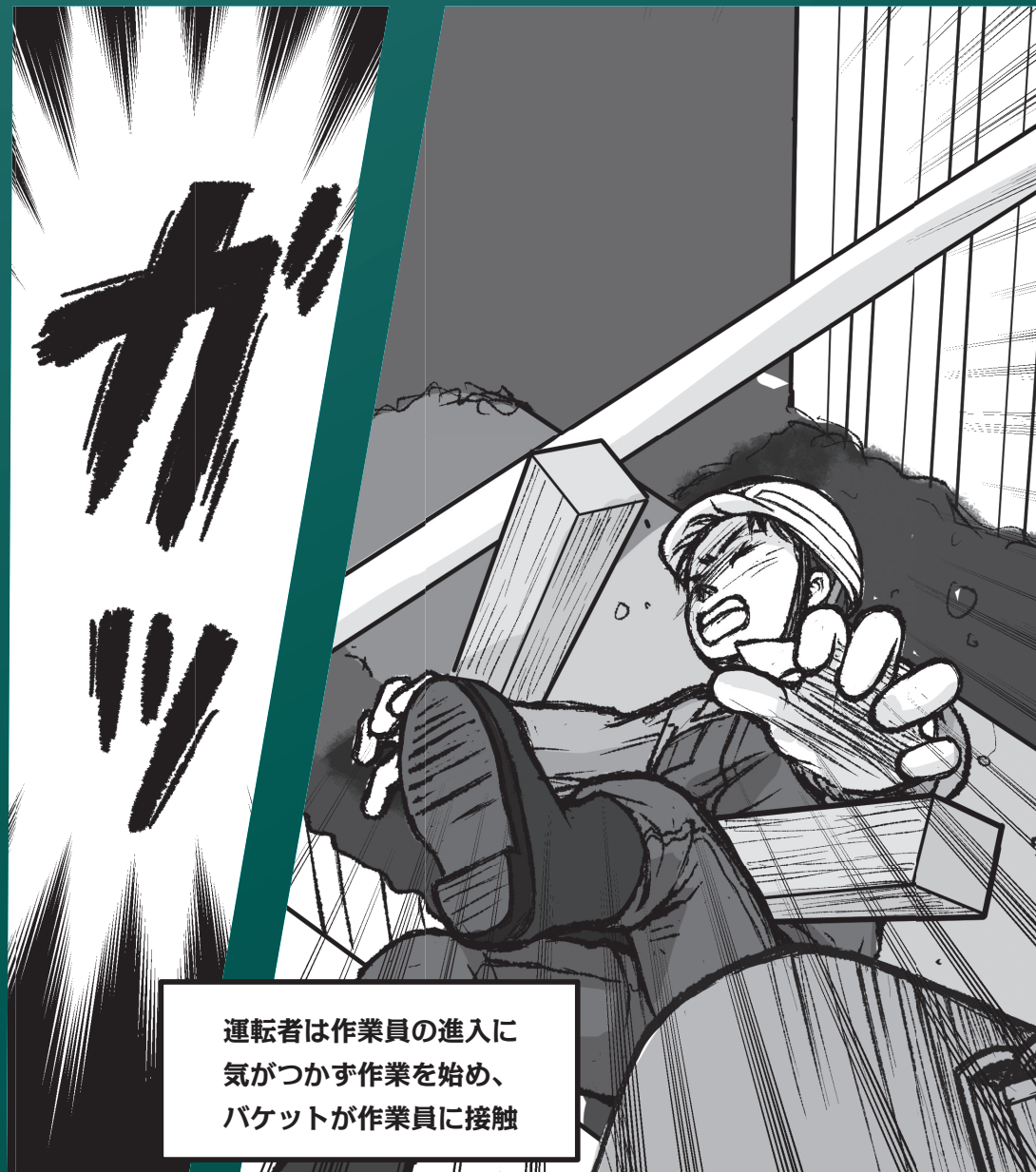
運転者は作業員の進入に気がつかず作業を始め、バケットが作業員に接触