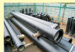
▲水道局で備蓄している水道管