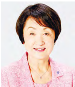
よこはましちょう 横浜市長 はやし ふみこ 林 文子

みなさん、お元気で新年をおむかえになったと思います。私もたいへんうれしく思っています。オリンピック・パラリンピックの年が始まりました。横浜でオリンピックの野球とソフトボール、サッカーが行われます。大会の前には英国のキャンプ地にもなります。そして8つの国のホストタウンとして交流します。「ヨコハマトリエナーレ2020」もあります。魅力あふれる都市として、世界に横浜を知らせていきます。