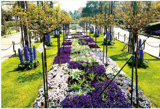
5 월에는 보행자 머리 위로 장미로 만든 아치가 이어집니다

연속되는 장미 아치와 오벨리스크*를 통한 입체적인 연출이 눈길을 끈다. 기존의 장미에 새로운 장미와 다양한 종류의 화초를 더해 다채롭게 리뉴얼.