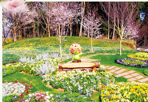
가든 베어의 포토 스폿에서 기념 촬영을

홍보 친선 대사 미카미 마사시 씨가 디자인 한 웰컴 가든에서는 미카미 씨를 이미지하여 만들어진 장미의 품종 '爽 ( 소 )' 가 절정기를 맞이한다.