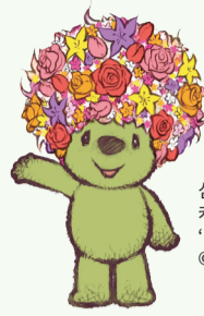
심벌 캐릭터 '가든 베어' © ITOON/GN2017

5 월 초순부터 시의 꽃인 '장미' 가 절정기를 맞이합니다. 요코하마 페어 각 행사장의 장미 정원에서는 전시 방법의 테마를 바꿔 거기에 맞는 다양한 품종의 장미가 자태를 뽐냅니다. 다채로운 장미의 경연을 즐겨 주십시오.