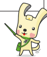
'요코하마 스리무!' 마스크트 이오

접수 시간 : 당일 반입 접수는 당일 15 시까지 . 코난 스톡야드의 일요일 반입 신청은 전날 16 시까지 .