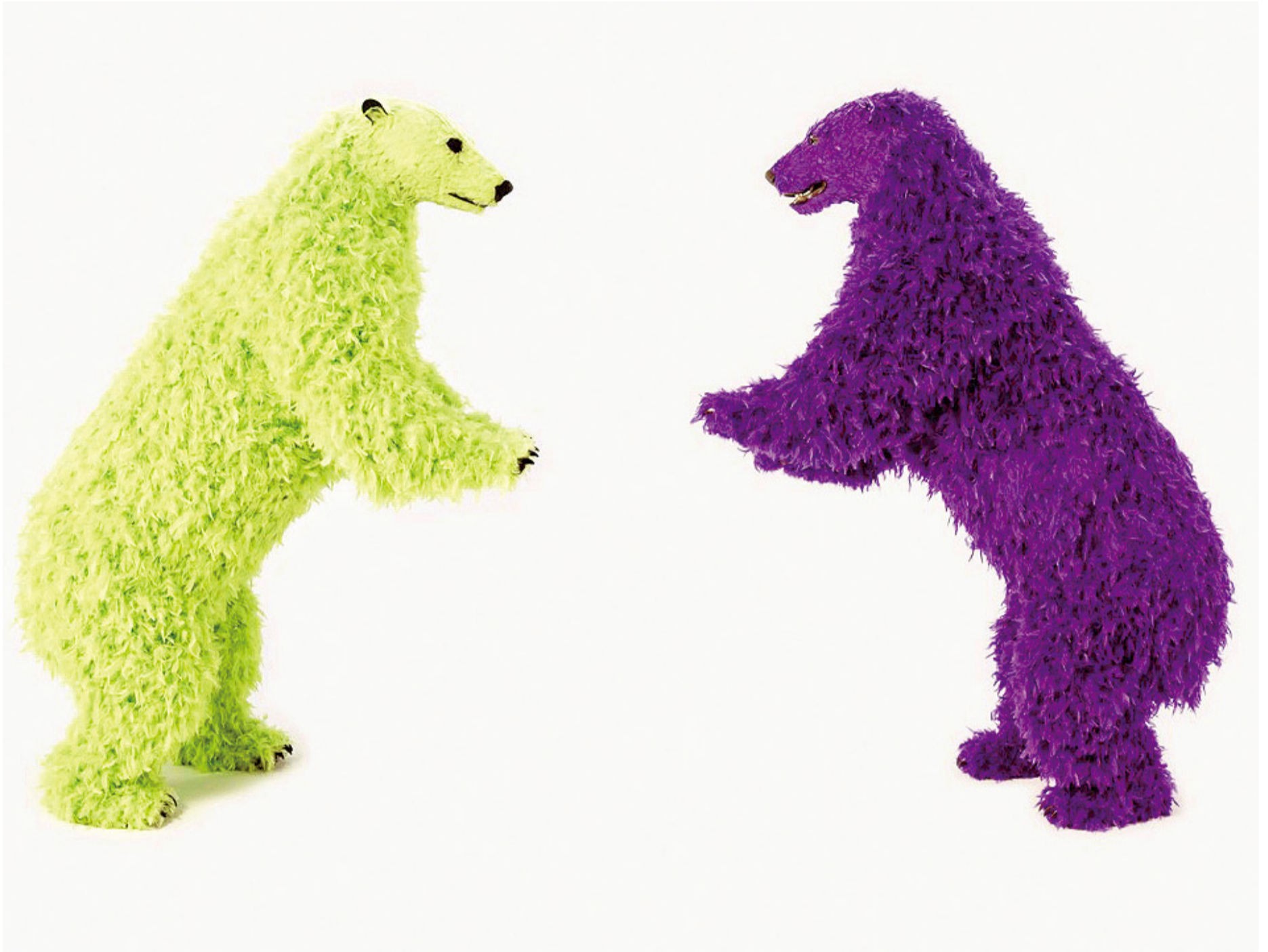
파올라 피비 《I and I (must stand for the art)》 2014