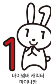
마이넘버 캐릭터 마이 나짱

※통지 카드 : 마이 넘버 ( 개인 번호 ) 를 알려 주는 종이로 된 카드입니다