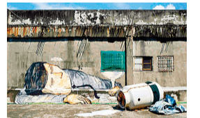
Candy Bird 《Office Worker》2016

【문의】 코가네초 에리어 매니지먼트 센터 전화: 045-261-5467 팩스: 045-325-7222