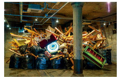
《Project God-zilla - Landscape with an Eye -》2016

버려진 목재나 전기 제품 등의 사이로 보이는 부리부리한 큰 눈을 표현한 야나기 유키노리의 작품. 작품명을 번역하면 '프로젝트 고질라-눈이 있는 풍경-' 입니다.