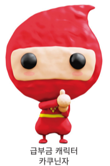
급부금 캐릭터 카쿠닌자

【문의】 전용 다이얼 (2017년 12월 28일까지 설치 매일 9시~18시)