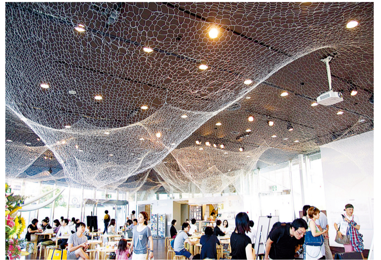
whitescaper 지난번 모습