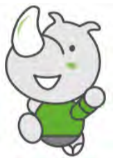
요코하마 시 발행 채권 마스코트 ‘하마사이’

특별 회계·기업 회계·외곽 단체를 포함한 ‘일반 회계가 대응하는 차입금 잔액’은 전년도 말에 비해 483억 엔의 감축을 도모하여 3조 1,830억 엔이 되었습니다.