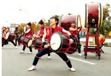
'요코하마 마라톤 2016' 급수 퍼포먼스의 모습

수도고속도로 만안선, 혼모쿠 부두 내 등 관람객은 출입할 수 없는 장소가 있으므로 주의해 주십시오.