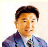
요시다 요시히토 씨 (전 남자 일본 대표 선수)