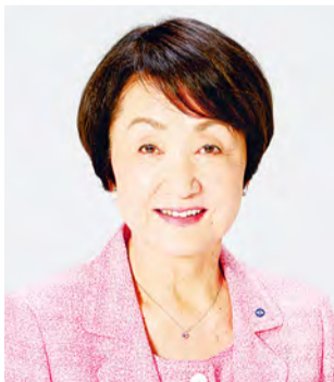
요코하마시장 하야시 후미코

늦더위에서 해방되어 가을바람을 맞으며 몸을 좀 움직여 보고 싶어지는 이 계절. 평소의 산책길보다 조금 멀리 돌아서 가 보는 것은 어떨까요? 저도 산책 코스를 가끔 바꿔, 시원한 바람에 흔들리는 코스모스 꽃과 물들기 시작하는 나무에서 계절의 변화를 느끼거나 몰랐던 가게를 찾아내기도 하고, 날마다 새로운 발견을 하면서 가을을 만끽하고 있습니다.