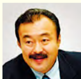
하야시 토시유키 씨 (전 남자 일본 대표 선수)