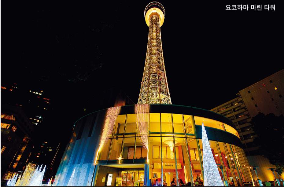
요코하마 마린 타워