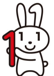
마이넘버 캐릭터 마이넘버짱

주기 카드의 전자 증명서 유효 기한은 발행 후 3 년간입니다. 카드 표면에 적힌 기한과는 다릅니다.