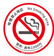
이 마크의 노면 표시가 그 표시입니다

미화 추진 중점 구역 내에서 담배꽂초의 산란 및 담배불에 의한 화상 등 피해를 끼칠 우려가 있는 옥외 공공장소에서 흡연을 금지할 필요가 있는 구역을 흡연 금지 구역으로 지정하고 있습니다. 지금까지 요코하마역 등 6개 구역을 지정해 왔습니다만, 새로 도쓰카역 주변을 흡연 금지 구역으로 지정합니다.