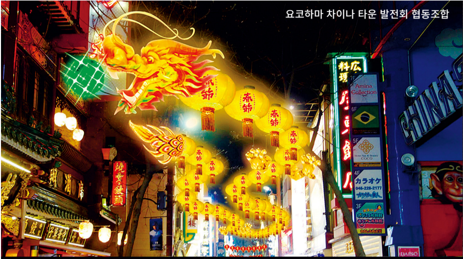
요코하마 차이나 타운 발전회 협동조합