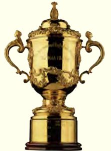
TM © Rugby World Cup Limited 1986. All rights reserved.

이밖에 세트권은 1월 19일(금)부터, 일반 티켓은 2월 19일(월)부터 JRFU 멤버스 클럽, 선ول브스 공식 팬클럽 회원 등을 대상으로 한 선행 추첨 판매도 실시됩니다.