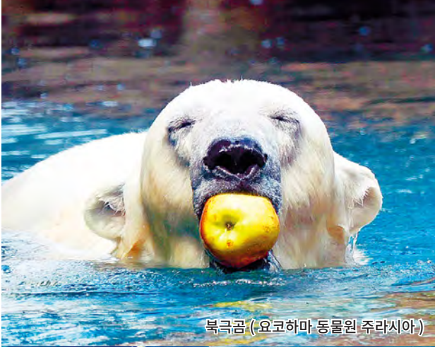
북극곰 (요코하마 동물원 주라시아)