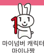
마이 넘버 캐릭터 마이 나짱

또한 신청용 봉투가 없는 경우에는 홈페이지에서 다운로드할 수 있습니다 .