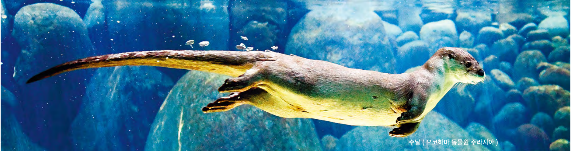
수달 (요코하마 동물원 주라시아)