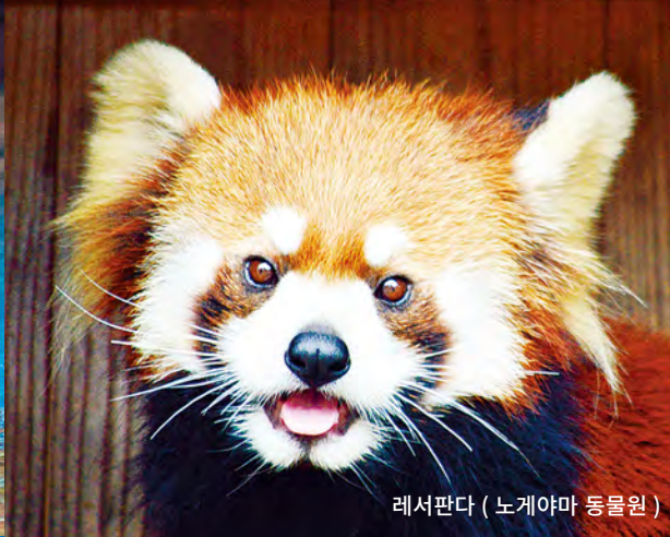
레서판다 (노게야마 동물원)