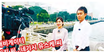
아마시타 공원에서 오프닝 촬영