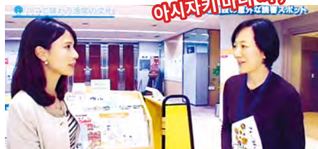
남녀 공동 참획 센터 요코하마의 정보 라이브러리를 소개