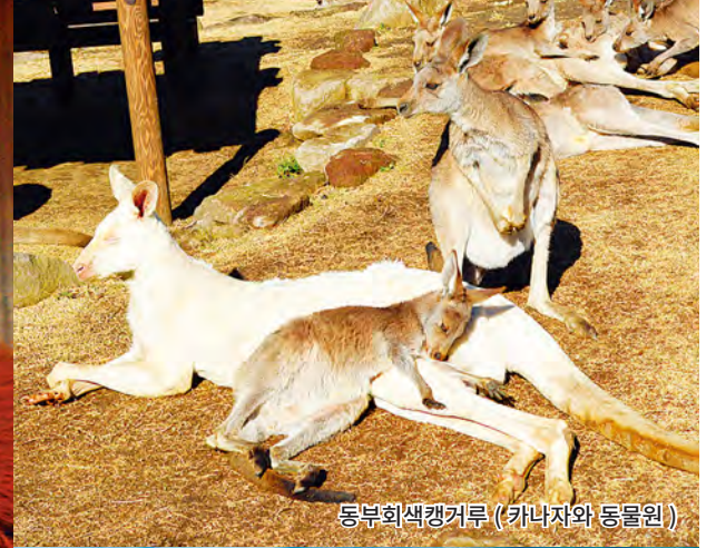
동부회색캥거루 (카나자와 동물원)