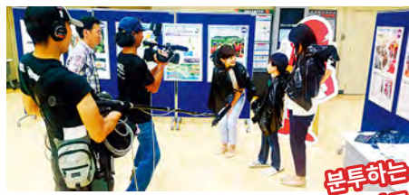
쓰레기봉투로 만드는 간편 비웃