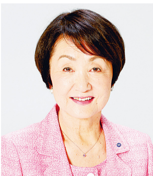
요코하마시장 하야시 후미코