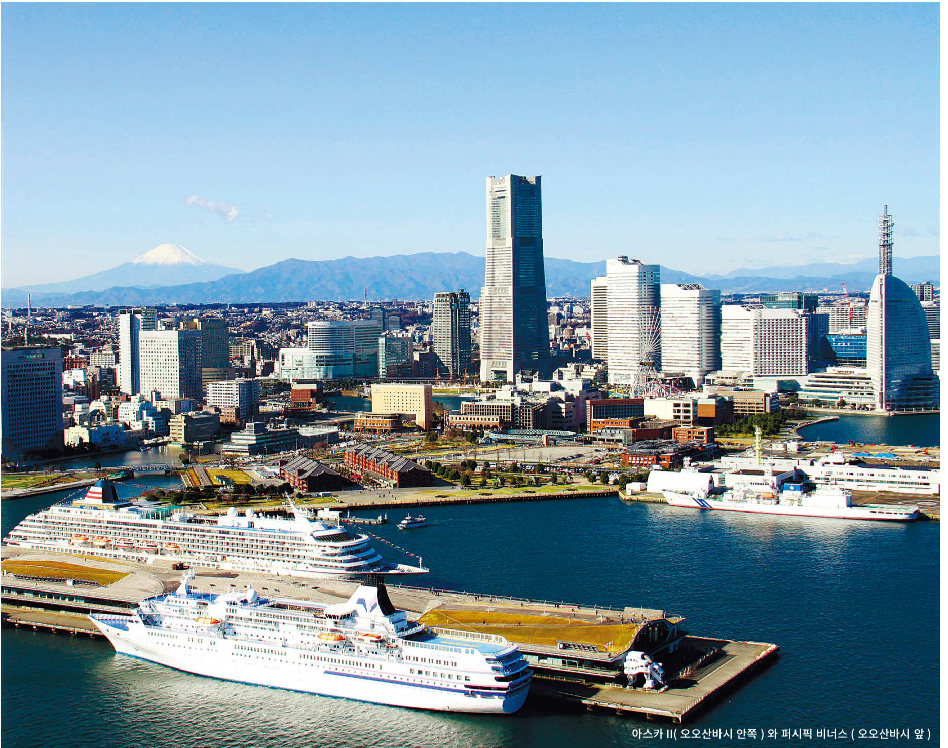
아스카 II(오오산바시 안쪽)와 퍼시픽 비너스(오오산바시 앞)