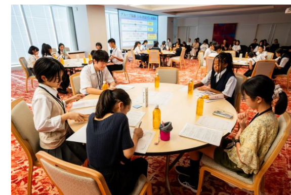
子どもたちによる学習会の様子