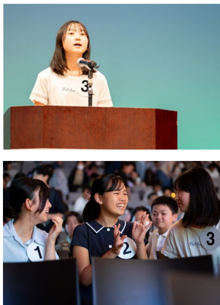
2024年 スピーチコンテスト本選の様子