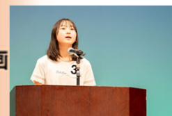
横浜市HP スピーチ動画 報告書で 活動を知る