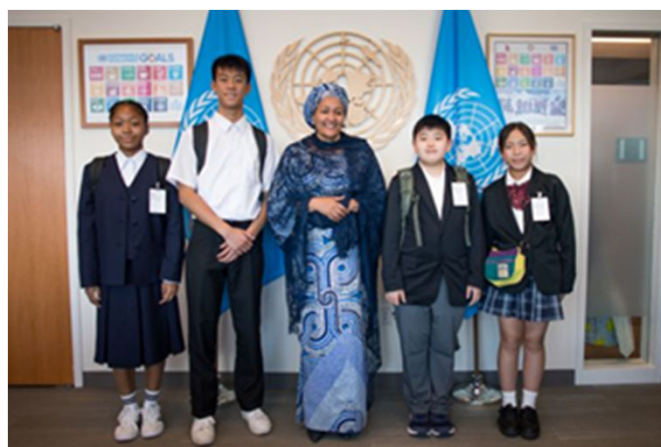
モハメッド国連副事務総長との 会談後の記念撮影