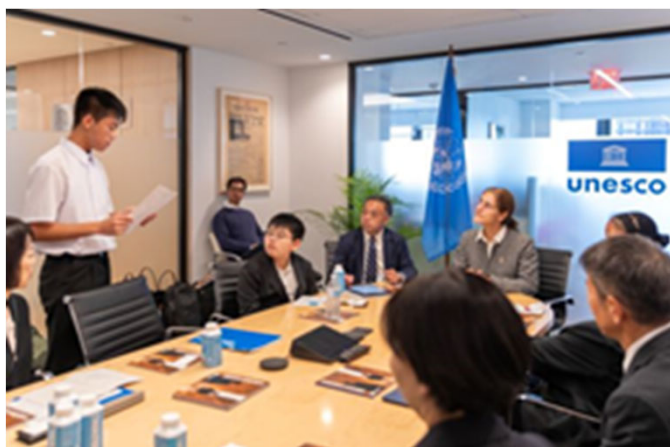
ユネスコ ニューヨーク事務所での会談