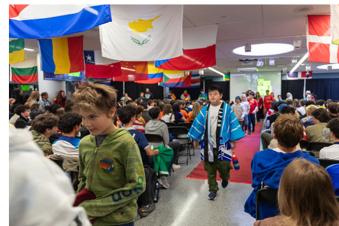
UNISデイ（国連国際学校祭）への参加