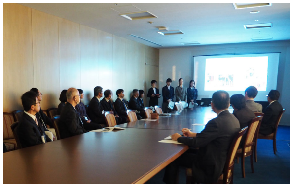
子どもピースメッセンジャーによる報告