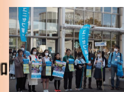
桜木町駅前 街頭募金参加 12月14日予定