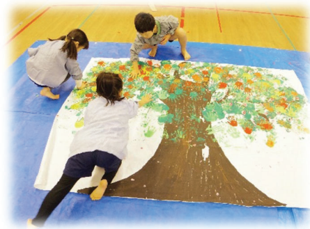
アート・スポーツ