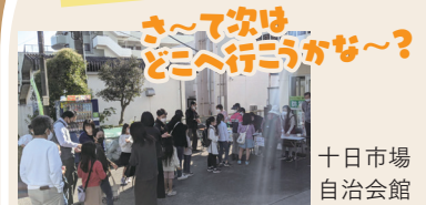
十日市場自治会館