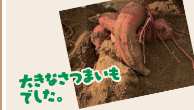
大きなさつまいもでした。