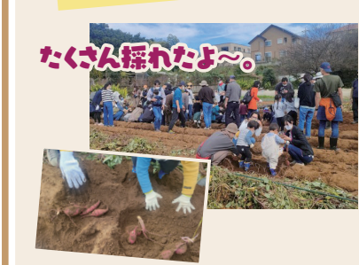
たくさん採れたよ〜。