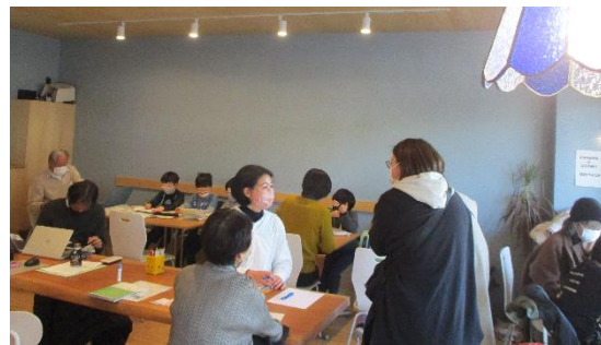
保護者も子どもたちの様子を見に立ち寄っています。

A. 「楽しかった！また来るね！」と言ってくれる子どもたちのためにも、この活動を継続していきたいです。子どもたちにとって、ただ勉強をするためだけの場所ではなく、ほっとできる居心地の良い場所となり、家でも学校でもない「第三の居場所」となることが目標です。保護者の方にとっても安心の場所になれば嬉しいです。