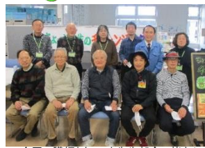
今回の講師とちょっと先生部会の皆さん

緑区生涯学習ボランティア人材バンク「ちょっと先生」が講師となり4講座(マジック・工作・バルーンアート・歴史散策)を開催しました。