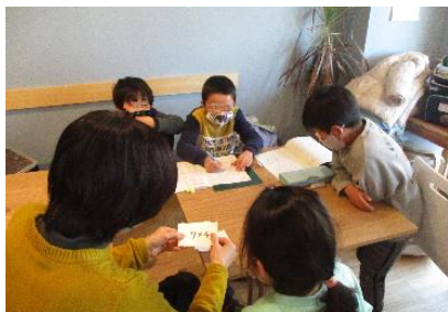
カードを使った九九の勉強に大盛り上がり！