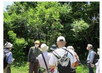
令和4年度「自然を楽しむ」の様子 ～玄海田公園～

【対象】5～6km歩ける人 【会費】2,000円（全5回分）※交通費は受講者負担