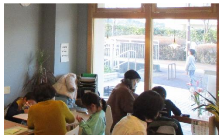
店内から、下校する子どもたちの様子を見守ることができます。

A. 街で偶然「ぷらっとSTUDY」に参加している子どもたちに出会ったときに「おーい」と手を振りあえる関係性ができていることがとても嬉しいです。子どもたちに、「保護者や学校の先生だけでなく、地域でもたくさんの方が、いつでもあなたのことを見守っている、つながっている」と感じてもらえるような、あたたかな地域の実現を目指しています。