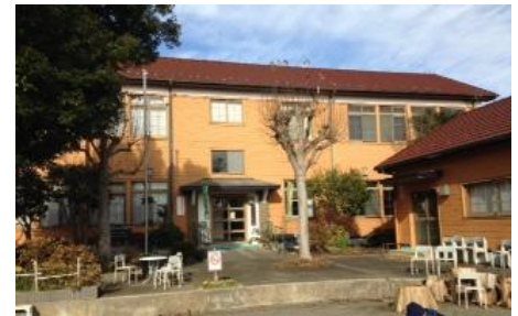
旧山下小学校校舎（横浜市長古の木造校舎） 山下地域交流センター施設として活用中

【会費】公開講座：無料 / 連続講座：1,500円（全6回分）※交通費は受講者負担