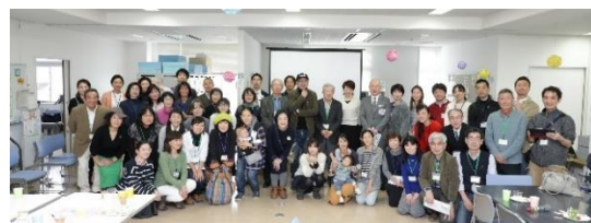
「Vol.2 DAY (昼版)」参加者と集合写真