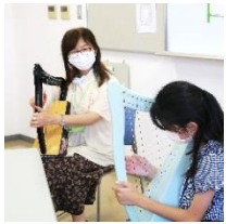
夏休み子ども体験講座の様子(8月4日撮影)