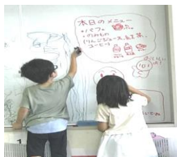
食事の後に自由に遊ぶ子どもたち