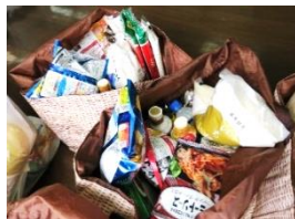
仕分けが大変なフードギフト

A.困っている人をより確実に支援したい、という思いから、フードギフト(食料配布)も始めました。また、進学にあたって必要なものを購入する商品券の配布も行っています。