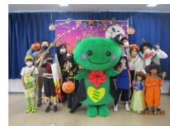
次回は、「中山ハロウィン+ 地域交流 Vol.19」 令和5年10月29日(日)

Open!みどリーむが、今までチャレンジできたのは、ゲストの協力、参加者や地域の皆さんの支えがあったからです。実行委員会は、これからも様々な人や団体と連携して「Open!みどリーむって面白いよね、つながりが生まれるね。」と言われるような活動を目指していきます。 令和6年2月17日に20回を迎えるにあたり、皆さんのアイデアを募集中です。実行委員になって一緒に活動しませんか。