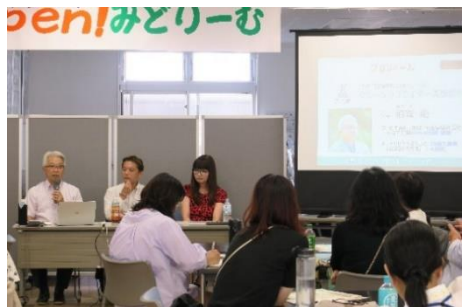
「人がつながる地域ビジネスとは?Vol.18」 貴重な体験談を語ってくれたゲストの3人