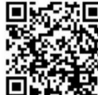
みどリーむ運営委員会 YouTube