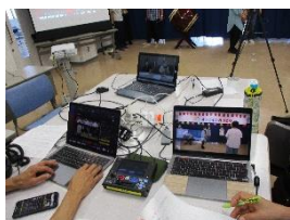
「オンラインで緑区首頭を踊ろう Vol.12」配信の舞台裏

みどリーむで「地域の異業種交流会」のようなことができないか?というのが出発点。みどリーむで取り組む、何だか難しそうな「市民活動」「社会課題」に対しても、「開かれた施設」をイメージできるように、名称は「Open!みどリーむ」に決定。さらに内容を連想できるように「地域交流、見つかる、つながる!」というキャッチフレーズが生まれました。