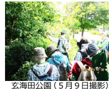
玄海田公園(5月9日撮影)