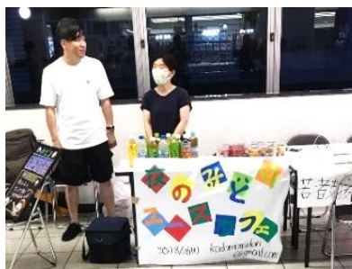
センター南駅前での若者支援活動の様子

A.立ち上げの際には、クラウドファンディングを利用しました。今は、寄付金や補助金(県、市、ユーコープなど)、農水省の備蓄米、セカンドハーベスト・ジャパン等のフードバンクを活用しています。地元の人からの寄付もあります。