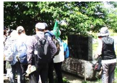
山下小学校発祥の地碑(4月21日撮影)